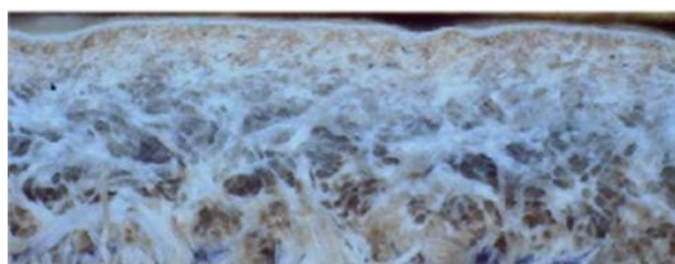
图 1 头层皮革横截面高倍显微镜图